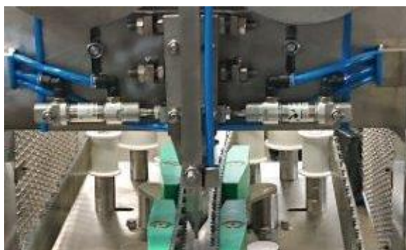
Pneumatyczny system do napinania pił