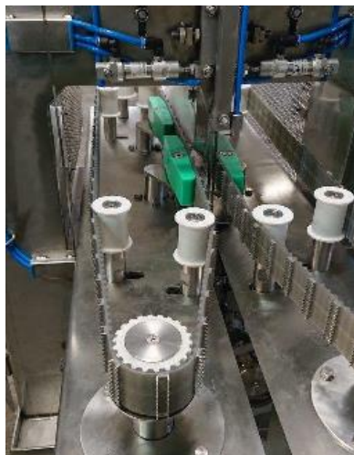
Precyzyjny system prowadzenia ryby